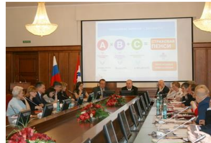
На заседании Комитета его участники познакомились с пенсионной формулой

Для возникновения права на установление страховой пенсии по старости, разъяснила докладчик, необходимо соблюдение определенных условий: достижение возраста, а также наличие минимального страхового стажа и количества пенсионных баллов. Если условия не соблюдены - право на страховую пенсию не возникает. По итогам прошлого года по причинам недостатка минимального количества стажа и пенсионных коэффициентов (например, человек не был официально трудоустроен) органами ПФР